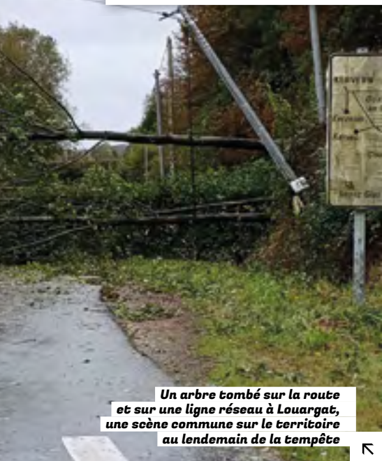
Un arbre tombé sur la route et sur une ligne réseau à Louargat, une scène commune sur le territoire au lendemain de la tempête