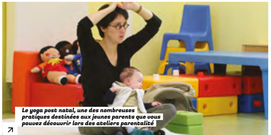
Le yoga post natal, une des nombreuses pratiques destinées aux jeunes parents que vous pouvez découvrir lors des ateliers parentalité

Partenaire du Collectif Parentalité du pays de Guingamp, l'Agglomération est un acteur important dans le domaine de l'accompagnement à la parentalité. Ses actions visent à conforter les compétences des parents, notamment aux périodes charnières du développement des enfants, quand l'exercice de la parentalité peut être mis à l'épreuve. Le service Parentalité et le Relais Petite Enfance de Guingamp-Paimpol Agglomération organisent des ateliers parentalité à destination des parents, des futurs parents et des professionnels de la petite enfance sur tout le territoire : portage en écharpe, cycle de massage bébé, yoga pré et post natal, atelier co-naître ensemble, mon enfant en mouvement, éveil sensorimoteur et soirées à thèmes... ●